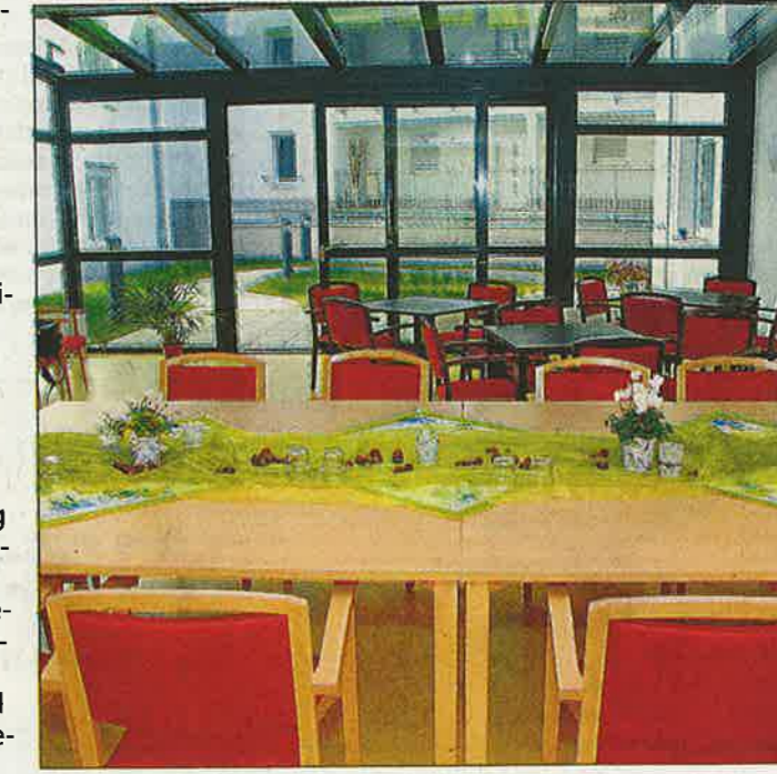
Im Speisesaal hindert nichts den Blick nach außen.

beides gelungen. Durch unterschiedliche Dachformen und abgesetzte Gebäudeteile wirkt das Gebäudeensemble optisch aufgelockert, die Wirkung wird durch das farblich abgehobene Eingangsportal noch verstärkt. Energetisch entsprechen die beiden Gebäude Marktplatz 1 und 3 höchsten und modernsten technischen Vorgaben. Die Wärmeversorgung mittels Pelletheizung erfolgt über die Heizzentrale im Pflegeheim. In Zusammenhang mit dem Neubau der Hauptstraße wurde als letzter Bauabschnitt auch der Straßenabschnitt bis zur Neckarbrücke neu gestaltet. Zeitgleich wurden die Parkplätze am Seniorenzentrum angelegt. Durch die enge Abstimmung beider Maßnahmen zwischen Gemeinde und Bauträger ergibt sich dadurch ein harmonisches Gesamtbild der Verkehrssituation am Ortseingang von Neckartenzlingen.