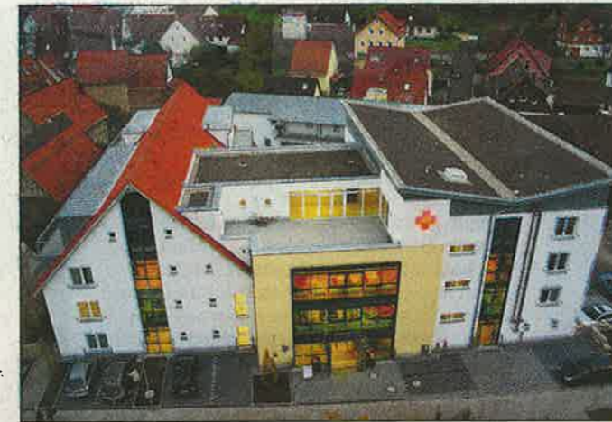
Das Haus am Schönrain fügt sich städtebaulich ein.

Seit am 1. Oktober die ersten Bewohner ins Haus am Schönrain eingezogen sind, hat sich das neue Haus nahtlos und schnell in den Verbund der DRK-Seniorenzentren eingliedert. Dass sich die Bewohner wohl fühlen und gut versorgt wissen, ist den beiden Geschäftsführern der neu gegründeten Heimbetreibergesellschaft, „DRK-Haus am Schönrain gGmbH“, DRK-Kreisge-